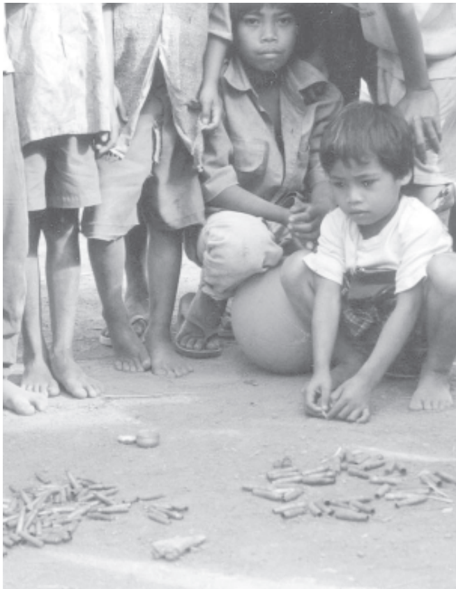
8 Pagkatawhonong Pamalita-Kalinaw: